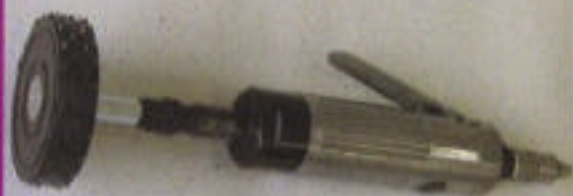
φ6コレットチャック