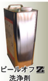
ピールオフ Z 洗浄剤